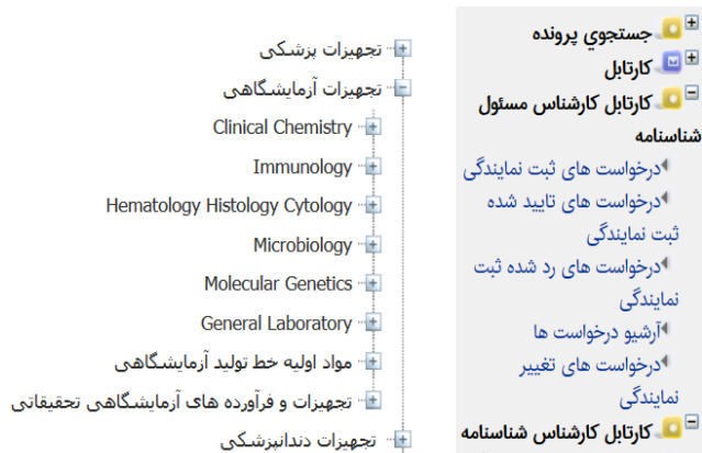
شکل ۳- سطح دوم از سرشاخه تجهیزات آزمایشگاهی