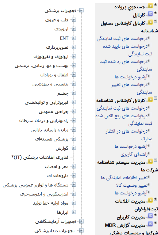
شکل ۲- سطح دوم از سرشاخه تجهیزات پزشکی

نکته ۳: در مورد کالاهایی که ماهیت دستگاه دارند یک شاخه مربوط به قطعات یدکی و یک شاخه نیز با عنوان قطعات ساخت تعریف شده است که امکان انتخاب آن برای کاربر وجود دارد و برگ نهایی مربوط به این دوشاخه با عنوان سایر قطعات یدکی و سایر قطعات ساخت می‌باشد اما درخصوص لوازم جانبی کاربر باید هر لوازم جانبی را به عنوان برگ انتخاب نماید و امکان تعریف سایر لوازم جانبی وجود ندارد.