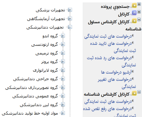
شکل ۴- سطح دوم از سرشاخه تجهیزات دندانپزشکی