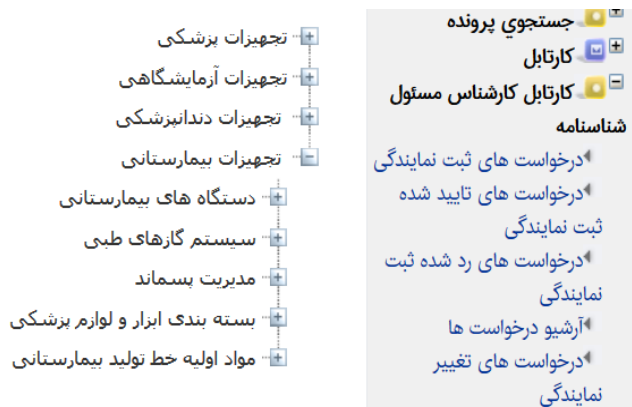
شکل ۵ - سطح دوم از سرشاخه تجهیزات بیمارستانی