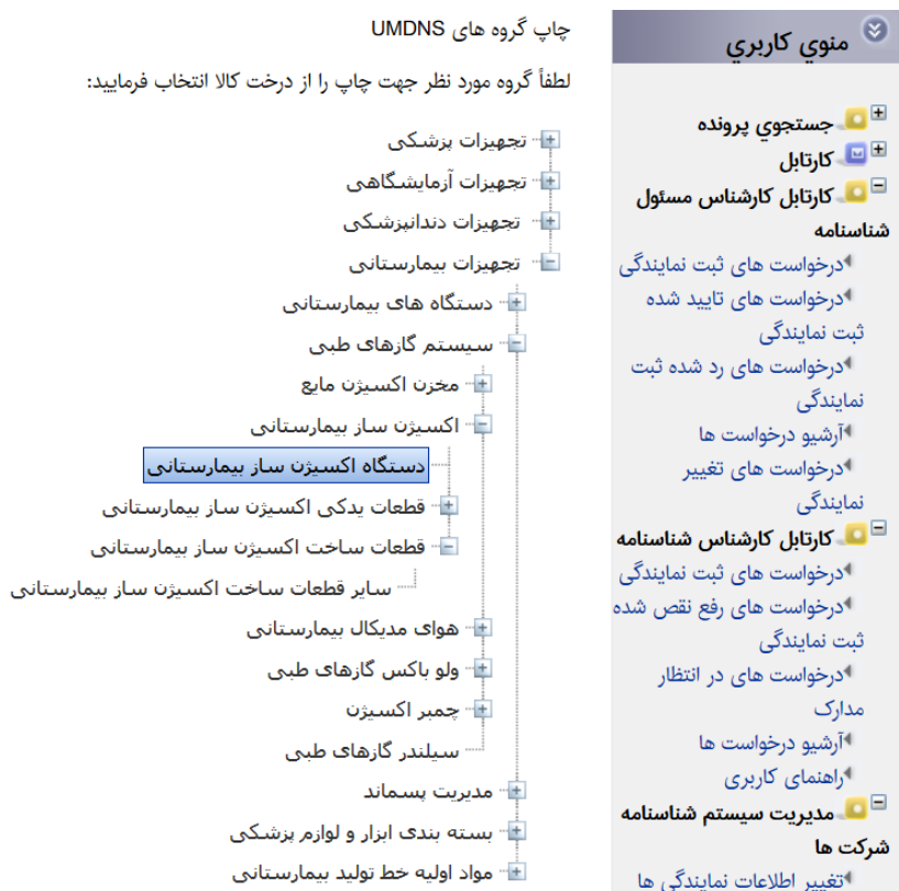
شکل ۶- مسیر درخت کالا برای انتخاب دستگاه اکسیژن‌ساز بیمارستانی

همان‌گونه در ابتدای راهنما ذکر شد پس از انتخاب صحیح سایر شاخه‌ها به عنوان سطوح بالاتر از درخت کالا نهایتاً می‌توان به برگ صحیح که بیانگر کالای مورد نظر است رسید، برای نمونه جهت انتخاب دستگاه اکسیژن‌ساز بیمارستانی مسیری که در شکل ۶ نشان داده شده طی می‌گردد.